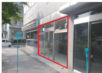
横浜中央病院 ビルエントランス