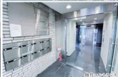
物件エントランス