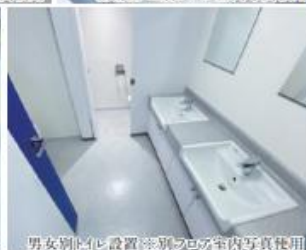
男女別トイレ設置 ※別フロア室内写真使用