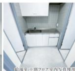
給湯室 ※別フロア室内写真使用