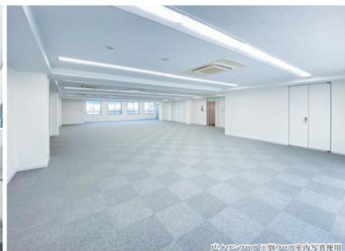
広々としたフロア ※別フロア室内写真使用