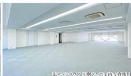
広々としたフロア ※別フロア室内写真使用